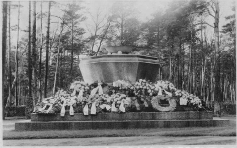
Abb.1: Ehrenmal für die im Weltkrieg gefallenen Memelländer