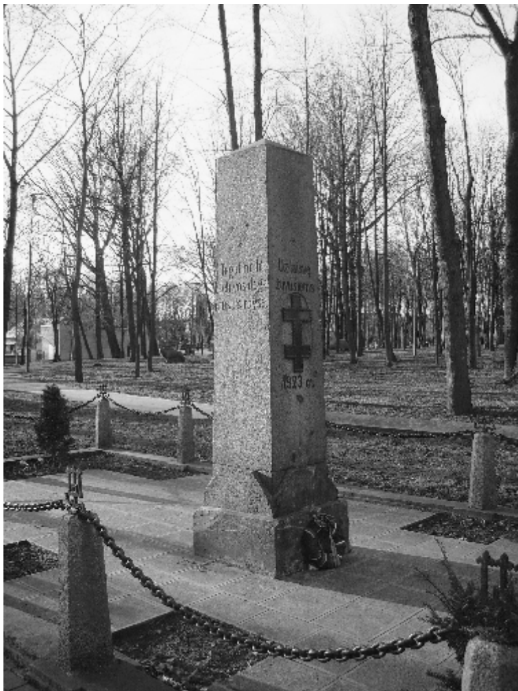
Abb.2: Denkmal „Den für die Freiheit Gefallenen“

Diese Widmung spiegelt das Selbstbild, das sich zu dieser Zeit unter den litauischen Memelländern, die dem Anschluss des Memellandes an Litauen